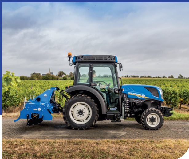
La suspension Terraglide™ s'engage automatiquement au-delà de 20 km/h pour améliorer le confort du conducteur.

S i le tracteur New Holland T4 V/N/F a dernièrement reçu le titre si convoité de Tractor of the Year 2020 dans la catégorie Best of Specialized, ce n'est pas un hasard ! La gamme T4, disponible en quatre modèles allant de 76 à 107 chevaux, offre une grande polyvalence avec ces trois versions V/N/F et surtout un grand nombre d'équipements assurant de la performance et du confort dans un segment où le développement reste complexe à cause de la compacité.