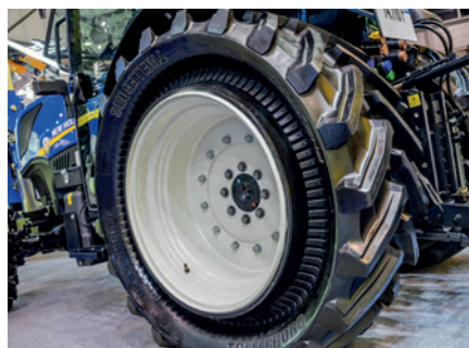
Le T4 est disponible en monte PneuTrac, de chez Trelleborg, ce qui permet une augmentation de la traction de 12 à 24 % !